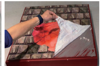
シート貼りによる糊残り