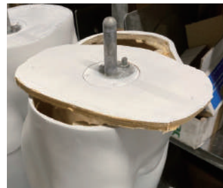
ボディの傷・破損

※破損があった場合は、すみやかに担当営業へご連絡をいただきますようお願い致します。